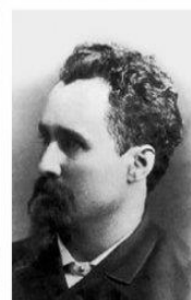
Oscar Neebe Vendedor de 36 años.

fuerzas policiales, mató a uno e hirió a otros varios. Aquella jornada pasó a la historia como la "Revolta (o Masacre) de Haymarket". Un grupo de 31 personas fue enjuiciada por el hecho. Ocho de ellos fueron condenados, dos de ellos a cadena perpetua, uno a 15 años de trabajos forzados y cinco a la muerte en la horca.